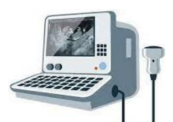
懷孕前三個月篩查 為高風險