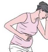
曾經患有 先兆子癇