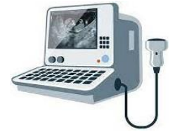
怀孕前三个月筛查 为高风险