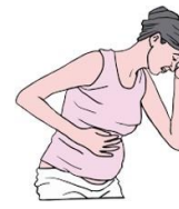
曾经患有 先兆子痫